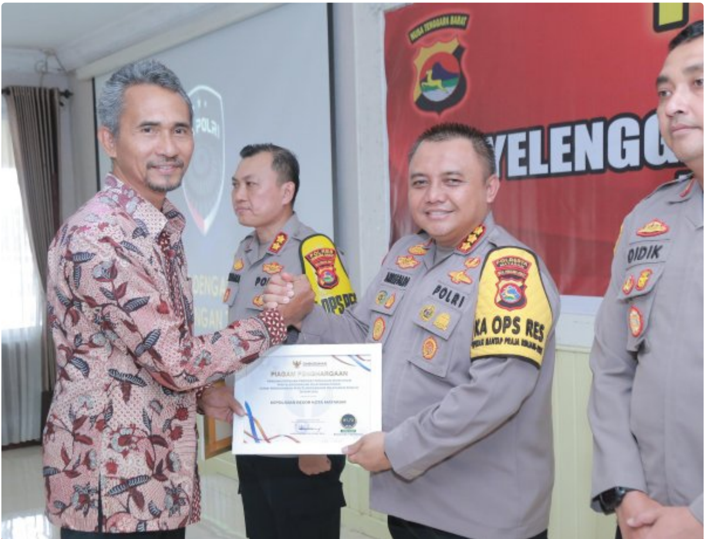
Kapolresta Mataram saat menerima Penghargaan dari Ombudsman RI perwakilan NTB, Kamis (19/12/2024)

MATARAM, NTB – Polresta Mataram kembali mengukir prestasi dengan meraih Predikat Kepatuhan Penyelenggaraan Pelayanan Publik Tahun 2024 dari Ombudsman NTB. Polresta Mataram menjadi salah satu dari delapan Polres/ta